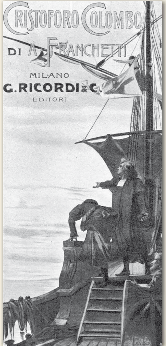
L'editore Giulio Ricordi e un manifesto di Ghislanzoni per un'opera dello stesso editore.