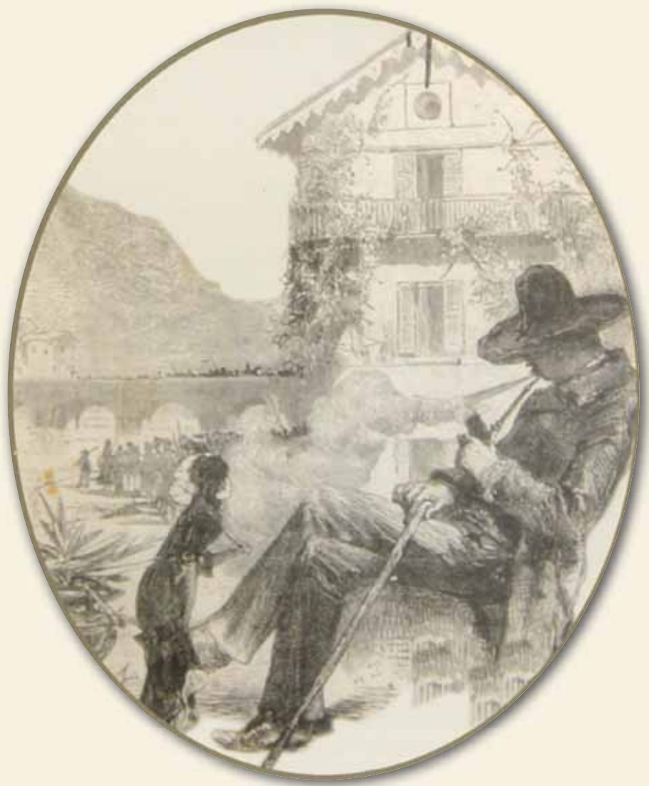
Un disegno di Vespasiano Bignami con Ghislanzoni e sullo sfondo il Ponte Visconteo di Lecco